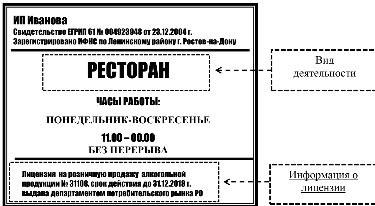
Рис. 3 Образец вывески с указанием вида деятельности и информации о лицензии

Если вид деятельности, осуществляемый исполнителем, подлежит лицензированию, до сведения потребителя должна быть доведена информация о номере лицензии , сроках действия указанной лицензии, а также информация об органе, выдавшем указанные лицензию (рис. 3).