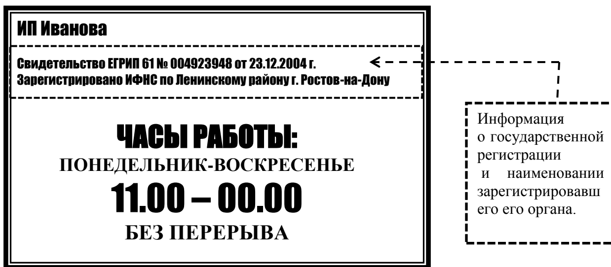
Рис. 2 Образец вывески индивидуального предпринимателя

Индивидуальный предприниматель предоставляет потребителю в наглядной информации о государственной регистрации и наименовании зарегистрировавшего его органа. (Рис.2).